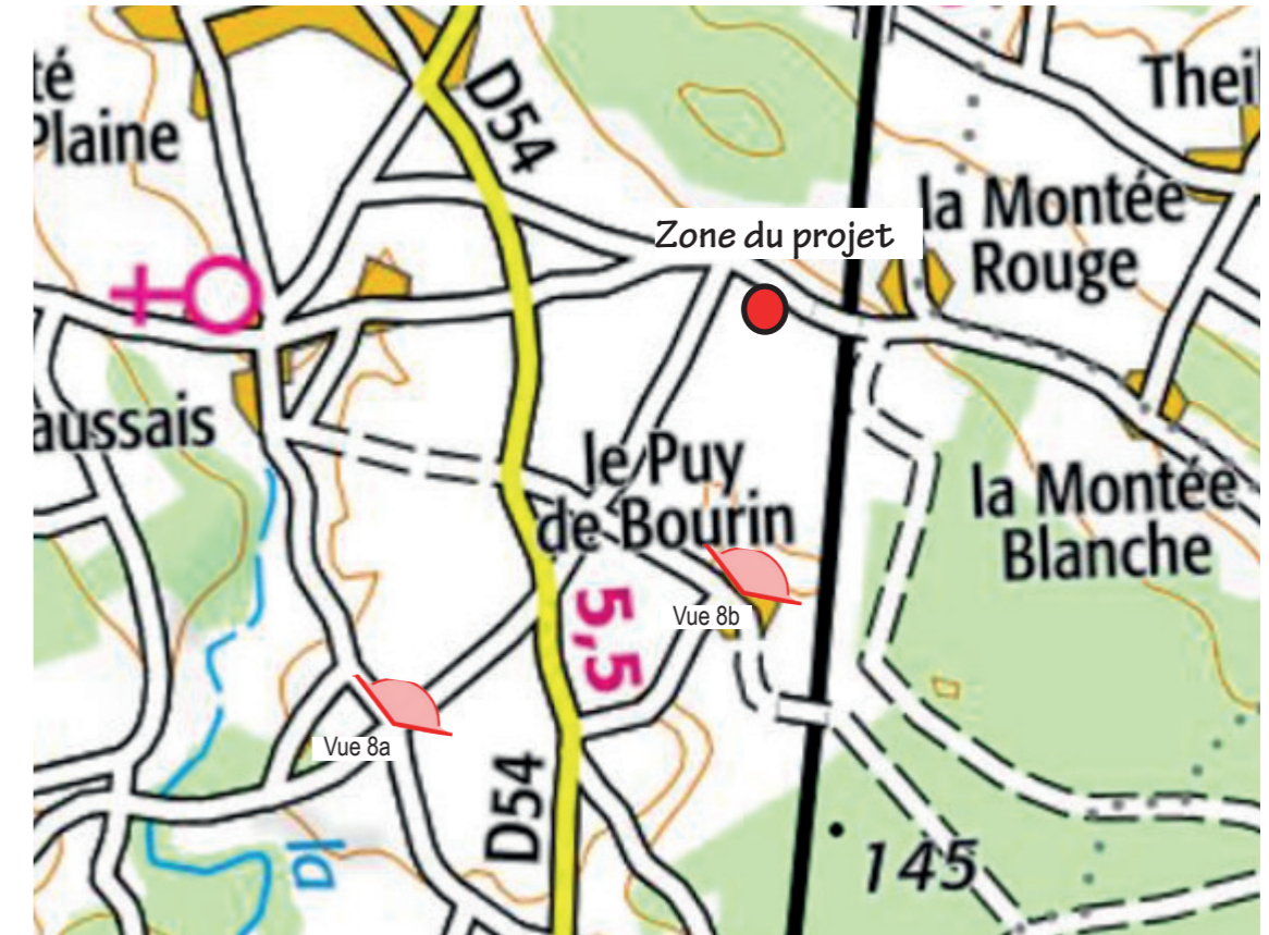
PLAN DE REPÉRAGE DES VUES